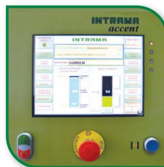
10" touch screen terminal