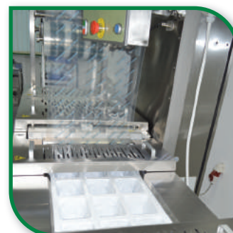
зона за зареждане