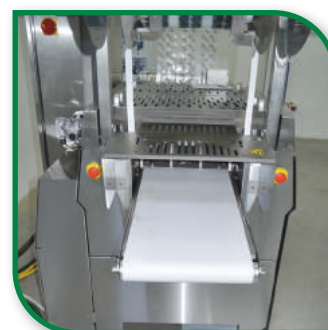
изходяща транспортна лента